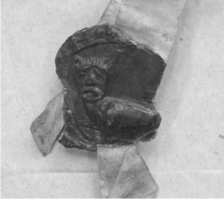
Afb. 2 Zegel van Wouter Reinfin, oudste bij naam bekende sluismeester van een watering in de Vlaamse kustvlakte (1277, watering Kamerlingsambacht) (RAB, Oorkonden met Blauw Nummer, 6752).

ken dat iemand die verkozen werd weliswaar verplicht was het ambt te aanvaarden, doch niet langer dan één jaar in functie diende te blijven. 71 Ook het feit dat de functie in de oudste reglementen als onbezoldigd wordt beschouwd, wijst in dezelfde richting. 72 Dit alles kan verklaren waarom we in de loop van de dertiende en veertiende eeuw sluismeesters aantreffen die behoren tot de lokale adel of de hogere clerus. 73 In de grote Blankenbergse watering, waar de clerus vanaf de veertiende eeuw recht had op een vaste vertegenwoordiger in het