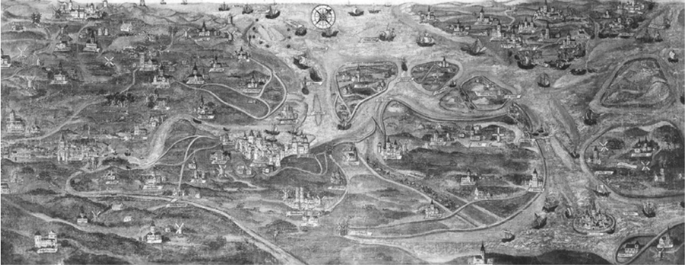
Afb. 1 Brugge, Groeningemuseum, inv. o. 1382, kaart van het kanaal van Oostburg en de Zwinstreek door Jan de Hervy, 1501. Copyright IRPA-KIK Brussel.

dig blijkt in het door de tijdgenoot gehanteerde discours over waterbeheer. Hieruit zal ook blijken dat het besluitvormingsproces zowel evenementieel als structureel vaak complexer was dan het Kommunale of CPR-model kunnen bevatten. We hebben het daarbij in de eerste plaats over interne machtsverhoudingen binnen de plattelandssamenleving zelf. Gezien het belang van de interregionale handel voor de economie van het laatmiddeleeuwse Vlaanderen, hoeft het geen betoog dat ook vanuit stedelijke hoek nauwlettend werd toegekeken op het waterbeheer in de Vlaamse kustvlakte. De talrijke kanalen die de kustvlakte doorkruisten gaven aanleiding tot complexe problemen, waarbij stedelijke handelsbelangen gecombineerd met een vorstelijk centralisatiestreven meer dan eens botsten met de verlangens van landbouw en plattelandssamenleving inzake afwatering en zeekeringen. 49